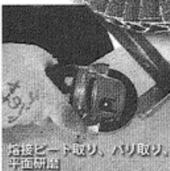
溶接ビード取り、バリ取り、 平面研磨