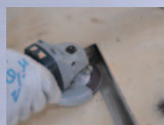
平面研磨、ピート取り、バリ取り