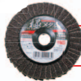
表 裏 横 三面使用可能!