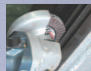
三面使用ミソ研磨