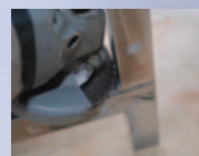
先端使用コーナー研磨