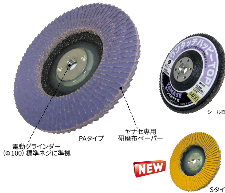
電動グラインダー (Φ100) 標準ネジに準拠